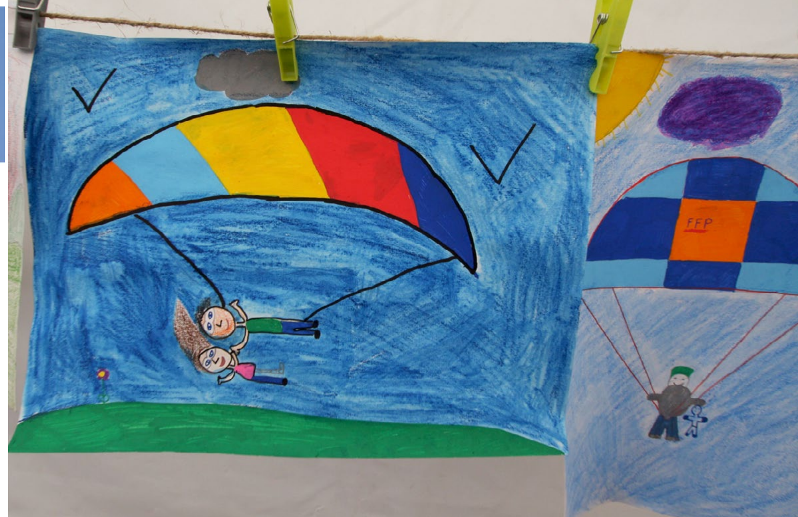
Lancio in Tandem visto dai Bambini delle Scuole Elementari Francesi